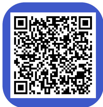
Menores de 16