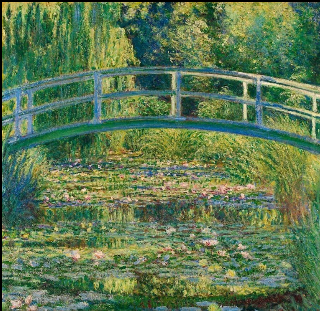
The Water Lily Pond, 1899 by Claude Monet